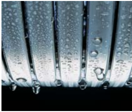
Inox-Radial-Wärmetauscher – langlebig und effizient