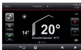
5-Zoll-Farb-Touch-Display der Regelung Vitotronic 200 (Typ HO2B)

* Voraussetzungen und Produktübersicht unter www.viessmann.de/garantie