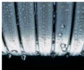
Inox-Radial-Wärmetauscher – langlebig und effizient