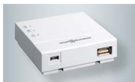
Vitoconnect 100 mit Anschlüssen für das Steckernetzteil (links) und zur Datenverbindung