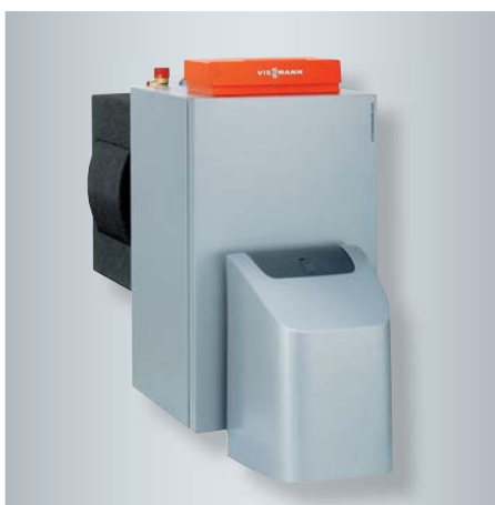
Vitorondens 200-T im Leistungsbereich von 67,6 bis 107,3 kW