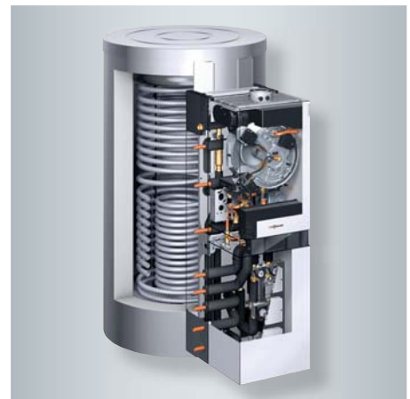
Vitosolar 300-F mit Öl-Brennwert-Heizgerät Vitoladens 300-W

Bereits ab Werk ist Vitosolar 300-F mit Heizkreisverteilung, Solarkreis Komponenten, wärmegeprägten Rohrleitungen und Absperrventilen vormontiert. Die Anschlüsse zur Einbindung eines zweiten Wärmeerzeugers, etwa eines Holzheizkessels, sind bereits vorgesehen. Alle Anschlüsse lassen sich abhängig von den Platzverhältnissen rechts oder links aus dem Gerät herausführen.